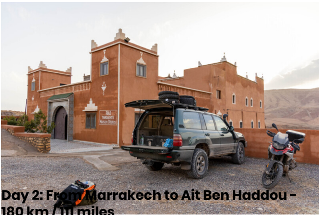
Day 2: From Marrakech to Ait Ben Haddou - 180 km / 111 miles

Hoy recorreremos la carretera que asciende al Tizi n'Tichka, un increíble paso a 2260 metros, a lo largo de una de las carreteras más hermosas del mundo. Luego pasaremos por la magnífica Kasbah de Telouet, donde haremos una breve visita. Continuaremos por caminos muy característicos, ascendiendo por las montañas del Atlas, por donde pasaban las caravanas que intercambiaban mercancías. Llegaremos a Ait Ben Haddou, donde cenaremos y pasaremos la noche en un típico hotel/Kasbah.