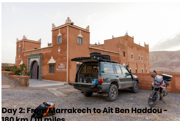
Day 2: From Marrakech to Ait Ben Haddou - 180 km / 111 miles

Hoy recorreremos la carretera que asciende al Tizi n'Tichka, un increíble paso a 2260 metros, a lo largo de una de las carreteras más hermosas del mundo. Luego pasaremos por la magnífica Kasbah de Telouet, donde haremos una breve visita. Continuaremos por caminos muy característicos, ascendiendo por las montañas del Atlas, por donde pasaban las caravanas que intercambiaban mercancías. Llegaremos a Ait Ben Haddou, donde cenaremos y pasaremos la noche en un típico hotel/Kasbah.