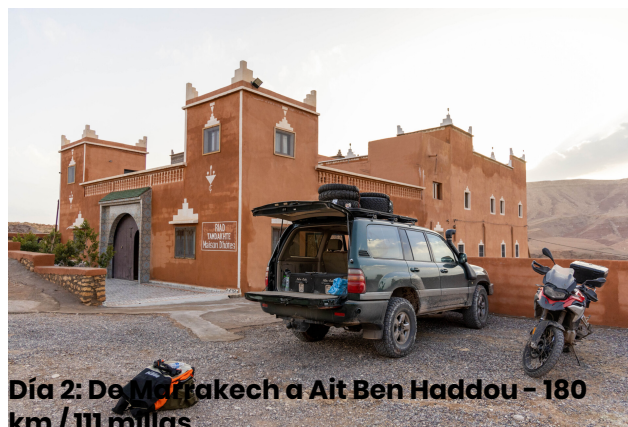
Día 2: De Marrakech a Ait Ben Haddou - 180 km / 111 millas

Hoy enfrentaremos el camino que sube a Tizi n'Tichka, un increíble paso a 2260 metros, a lo largo de una de las carreteras más hermosas del mundo. Luego pasaremos por la magnífica Kasbah de Telouet, donde haremos una breve visita. Continuaremos por carreteras muy pintorescas, ascendiendo las montañas del Atlas, por donde pasaban las caravanas que intercambiaban mercancías. Llegaremos a Ait Ben Haddou, donde cenaremos y pernoctaremos en un hotel / kasbah típico.