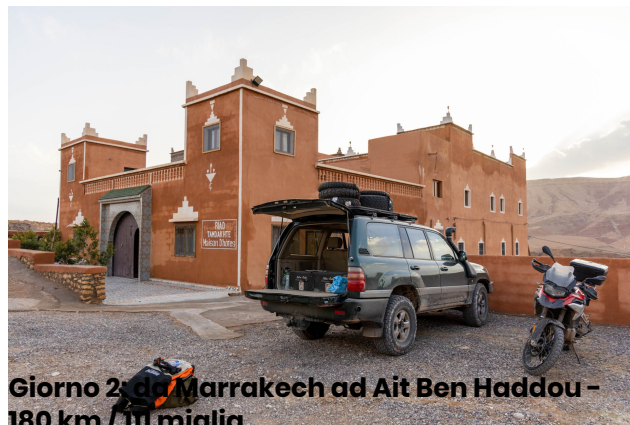
Giorno 2: da Marrakech ad Ait Ben Haddou - 180 km / III miglia

Oggi affronteremo la strada che sale al Tizi n'Tichka , un incredibile passo a 2260 metri, lungo una delle strade più belle del mondo. Passeremo poi davanti alla magnifica Kasbah di Telouet , dove faremo una breve visita. Percorreremo poi strade molto caratteristiche risalendo le montagne dell'Atlante, dove passavano le carovane che poi si scambiavano le merci. Arriveremo ad Ait Ben Haddou dove ceneremo e pernosteremo in un tipico hotel / kasbah.