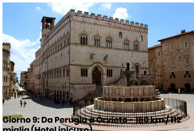
Giorno 9: Da Perugia a Orvieto – 180 km / 112 miglia (Hotel incluso)

Trascorri la giornata esplorando Siena, famosa per il Palio, la corsa di cavalli che si tiene due volte l'anno. Visita Piazza del Campo, dominata dall'elegante Torre del Mangia, e immagina la emozionante corsa senza sella che riempie la città di eccitazione e passione.