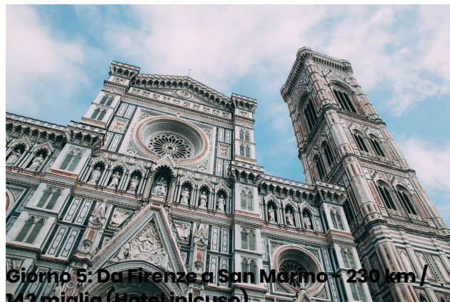
Giorno 5: Da Firenze a San Marino - 230 km / 142 miglia (Hotel incluso)

Inizieremo la giornata con una visita a Pisa, dove esploreremo l'iconica Piazza dei Miracoli e la famosa Torre Pendente. Continuando attraverso paesaggi pittoreschi, visiteremo villaggi suggestivi, tra cui San Gimignano, noto per le sue torri medievali che simboleggiavano il potere economico nel Medioevo. In serata, arriveremo a Firenze, la culla del Rinascimento.