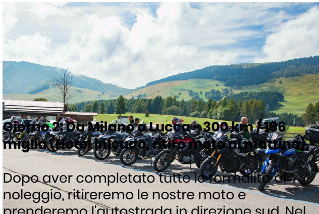
Giorno 2: Da Milano a Lucca - 300 km / 186 miglia (Hotel incluso, ritiro moto al mattino)

Dopo aver completato tutte le formalità di noleggio, ritireremo le nostre moto e prenderemo l'autostrada in direzione sud. Nel pomeriggio, arriveremo a Lucca, una città affascinante circondata da mura medievali perfettamente conservate. È fortemente consigliato noleggiare una bicicletta per esplorare la città.