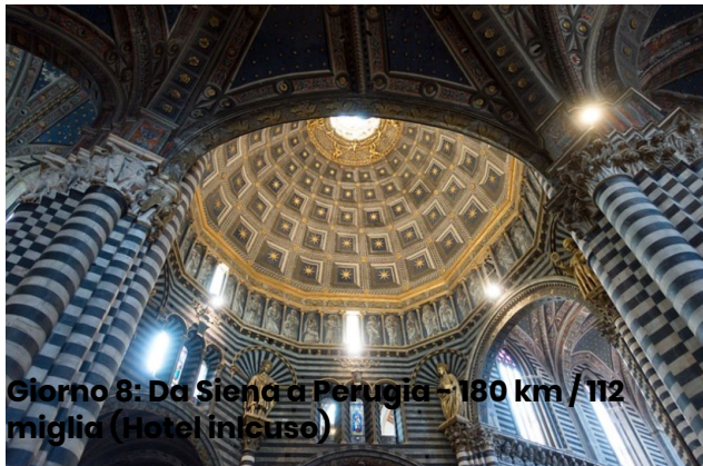
Giorno 8: Da Siena a Perugia – 180 km / 112 miglia (Hotel incluso)

Fiorentino, seguito da una visita al pittoresco borgo di Gubbio. Attraversando di nuovo la Toscana, raggiungeremo Siena, la storica rivale di Firenze, una città ricca di fascino medievale e cultura.