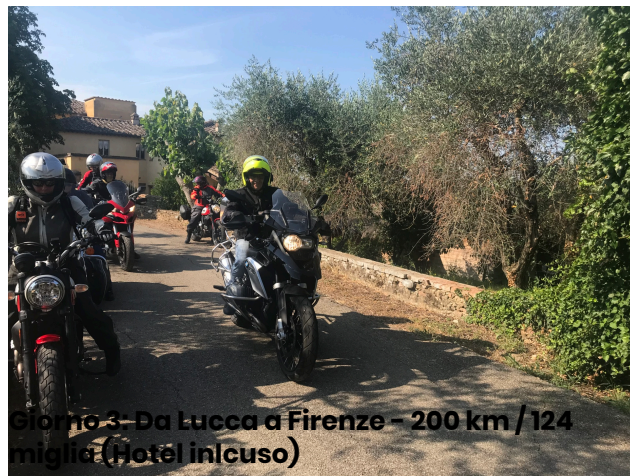
Giorno 3: Da Lucca a Firenze - 200 km / 124 miglia (Hotel incluso)

Benvenuto a Milano! In serata, ci riuniremo per una cena di benvenuto e un briefing per conoscerci meglio e prepararci per il viaggio che ci attende.