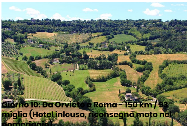
Giorno 10: Da Orvieto a Roma – 150 km / 93 miglia (Hotel incluso, riconsegna moto nel pomeriggio)

Percorreremo la panoramica Strada delle Crete, godendo di vedute mozzafiato delle iconiche colline toscane punteggiate di cipressi. Attraversando l'Umbria, passeremo vicino al Lago Trasimeno prima di arrivare a Perugia, capoluogo della regione, una città ricca di storia e fascino.