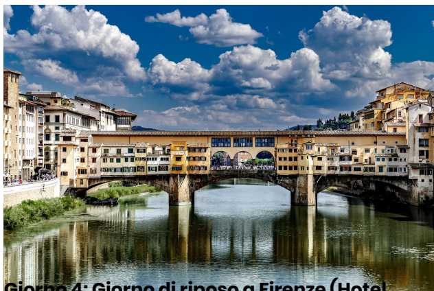
Giorno 4: Giorno di riposo a Firenze (Hotel incluso)

Dopo aver completato tutte le formalità di noleggio, ritireremo le nostre moto e prenderemo l'autostrada in direzione sud. Nel pomeriggio, arriveremo a Lucca, una città affascinante circondata da mura medievali perfettamente conservate. È fortemente consigliato noleggiare una bicicletta per esplorare la città.